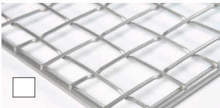
Preßgitter einseitig glatt